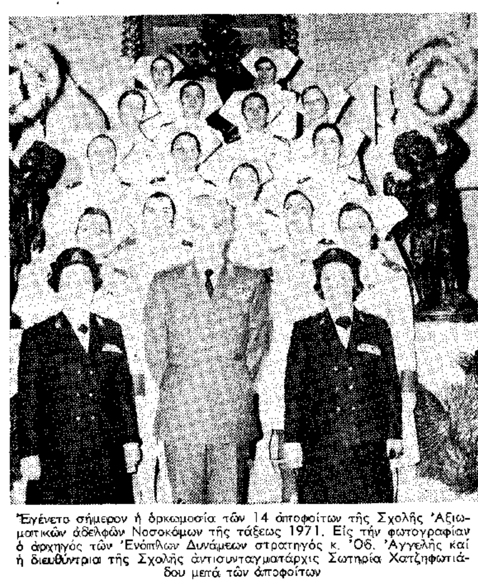
Ἐγένετο σήμερον ἡ ἀνακοίνωσις τῶν 14 ἀποστόλων τῆς Σχολῆς Ἀθηνῶν...